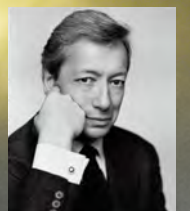
創設者 フレデリック・マル

爽やかな香りもいいが、男はときにセクシーな香りも必要。“破滅のムスク”とも称されるこちらは、官能的なムスク使いが得意なモーリス・ルーセルの作品。19年前に生まれたオリエンタルの名香は古さを感じず、むしろ新鮮な驚きさえある。大人の男だからこそこなせるアンバーやバニラのふくいくたる香りを味方にしたい。