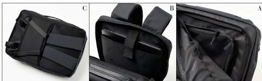
A: 外側のファスナーを開けるとまたファスナー付きのポケットが登場。人の多い場所での盗難防止として二重の安心感。L字型に開くファスナーは使いやすさ抜群 B: ストラップ付きのコンパートメントは15インチのパソコンもきれいに収まる C: リュックのストラップを収納すればスマートなブリーフケースとしても使用可能

メインファブリックにはマットな質感の撥水ポリエステル素材を採用。そぎ落とされた佇まいであらゆるコーデに馴染んでくれる。フロントパネルは強化ポリウレタン加工で保護され、キズがつきにくいのも嬉しい限り。こちらはB4サイズの書類が収納可能なほどよい大きさ。3万2000円(サムソナイト/伊勢丹新宿店)