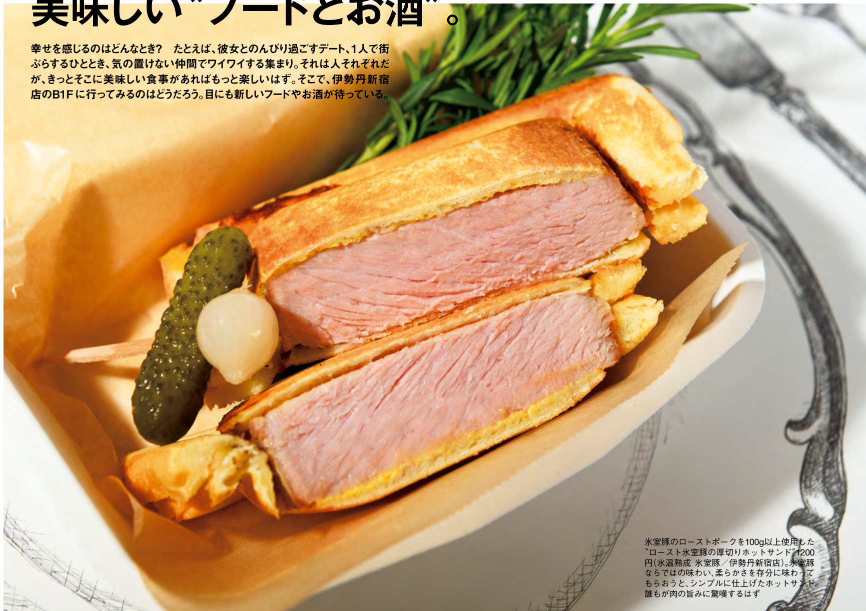
氷室豚のローストポークを100g以上使用した“ロースト氷室豚の厚切りホットサンド”1200円(氷温熟成 氷室豚/伊勢丹新宿店)。氷室豚ならではの味わい、柔らかさを存分に味わってほしいと、シンプルに仕上げたホットサンド。誰もが肉の旨みに驚嘆するはず

幸せを感じるのはどんなとき？ たとえば、彼女とのんびり過ごすデート、1人で街ぶらするひととき、気の置けない仲間でワイワイする集まり。それは人それぞれだが、きっとそこに美味しい食事があればもっと楽しいはず。そこで、伊勢丹新宿店のB1Fに行ってみるのはどうだろう。目にも新しいフードやお酒が待っている。