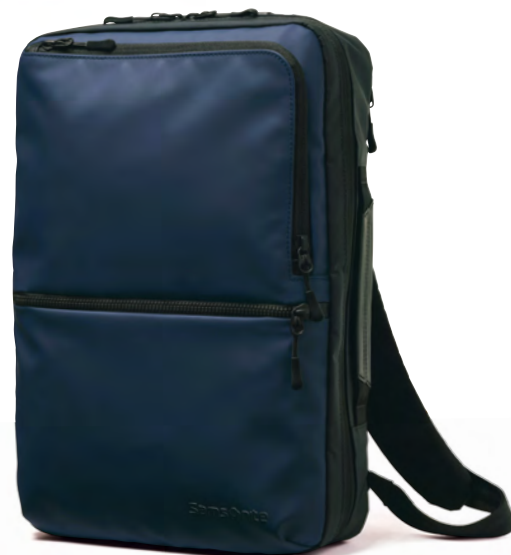
全体にサイズダウンしたこちらにはA4の書類がフィット。レザーパーツは耐久性を高め、格上げ効果も期待できる。3万円(サムソナイト/伊勢丹新宿店)