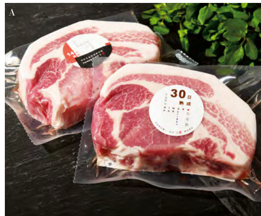
A:14日と30日の氷室熟成リブローズの厚切り。熟成日数の違いで舌が感じる旨みが異なるが、これは好みによるという。だからこそ、食べ比べがおすすめ。14日熟成100gあたり840円、30日熟成100gあたり1260円 B:希少部位は6種類。ネック、肩バラ、イチボ、シキンボウ、ランプ、スネ。各100gあたり650円(以上氷温熟成 氷室豚/伊勢丹新宿店) C:厳選された群馬県産の豚肉を氷温熟成した氷室豚が並ぶ店頭。真空パックだから、日持ちも長く安心 D:イートインスペースでは、カラダに優しいフルーツウォーターをフリーで飲めるように設置

氷室豚の唯一の専門店である伊勢丹新宿店では、イトインも併設されている。そのため、豚肉を知り尽くしたスタッフが上手に焼いてくれた“氷室豚のホットサンド”ができたてで食べられる。買い物の途中で小腹が空いたときにちょっと立ち寄るのもおすすめ。真空パックにされたお肉は、2週間ほど日持ちするので、お肉にこだわりを持つ人は是非買って帰って、休日に家で男料理を披露するというのもいい。