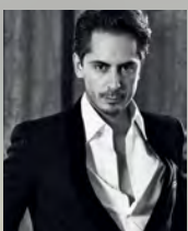
創設者 キリアン・ヘネシー

氷で冷やされたウォッカをイメージした爽快な香り。コリアンダーやローズ、ルバーブなどが絶妙なハーモニーを奏で、まわりを魅了する。ウォッカ オンザロック オールド パルファム。50ml。3万4000円(キリアン/伊勢丹新宿店)