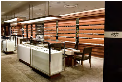
伊勢丹新宿店メンズ館1階にあったショップが、先日8階のイセタンメンズレジデンスへ移転してオープン。フィッティング専用スペースや、視力測定室も2室備えたゆとりある空間に生まれ変わった！