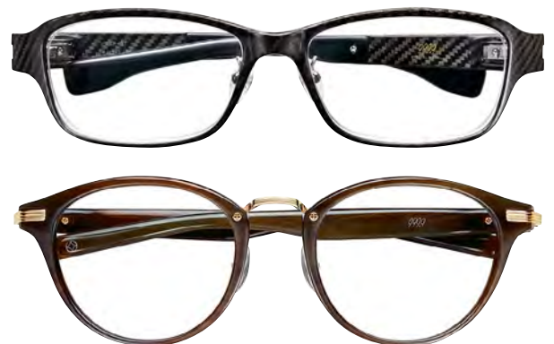
上：カーボンの特性を引き出す、オートクレーブ成形を採用しながら限界まで薄さを追求。どの角度からも美しいカーボン模様が見られる。28万円 下：贅沢な天然素材バツファローホーンを使用。独自機構と組み合わせ、快適な掛け心地を実現。14万円(以上フォーナインズ/伊勢丹新宿店)