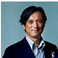
取材・文 中村孝則 美食評論家

1964年神奈川県葉山生まれ。ファッションからカルチャー、美食などをテーマに新聞や雑誌、テレビで活動中。主な著書に『名店レンビの巡礼修業』(世界文化社)がある。2013年より『世界ベストレストラン50』の日本評議委員も務める。さらに、グラナパダーノとバルマハムの親善大使に任命されている。