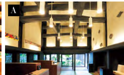
A:見上げるほど高い天井に、立派な梁がわたされたロビー。モダンなソファと蔵建築とのコントラストも絶妙。ロビーの先には昔ながらの瓦が積まれている B:江戸時代の文庫蔵を生かした図書館。建築や江戸美術、小布施にまつわる書物がずらり並び

遠 方からのお客をもてなす文化が息づいている小布施。(榎一客殿)の祖・高井鴻山も、葛飾北斎を招き、この地に文化遺産をもたらした。その流れは今も継続。江戸時代からの文庫蔵や砂糖問屋の土蔵3棟など12室を、(パークハイアット)で知られる建築家ジョン・モーフォードが基本設計を手掛けた。小布施の暮らしで得た彼のインスピレーションと、