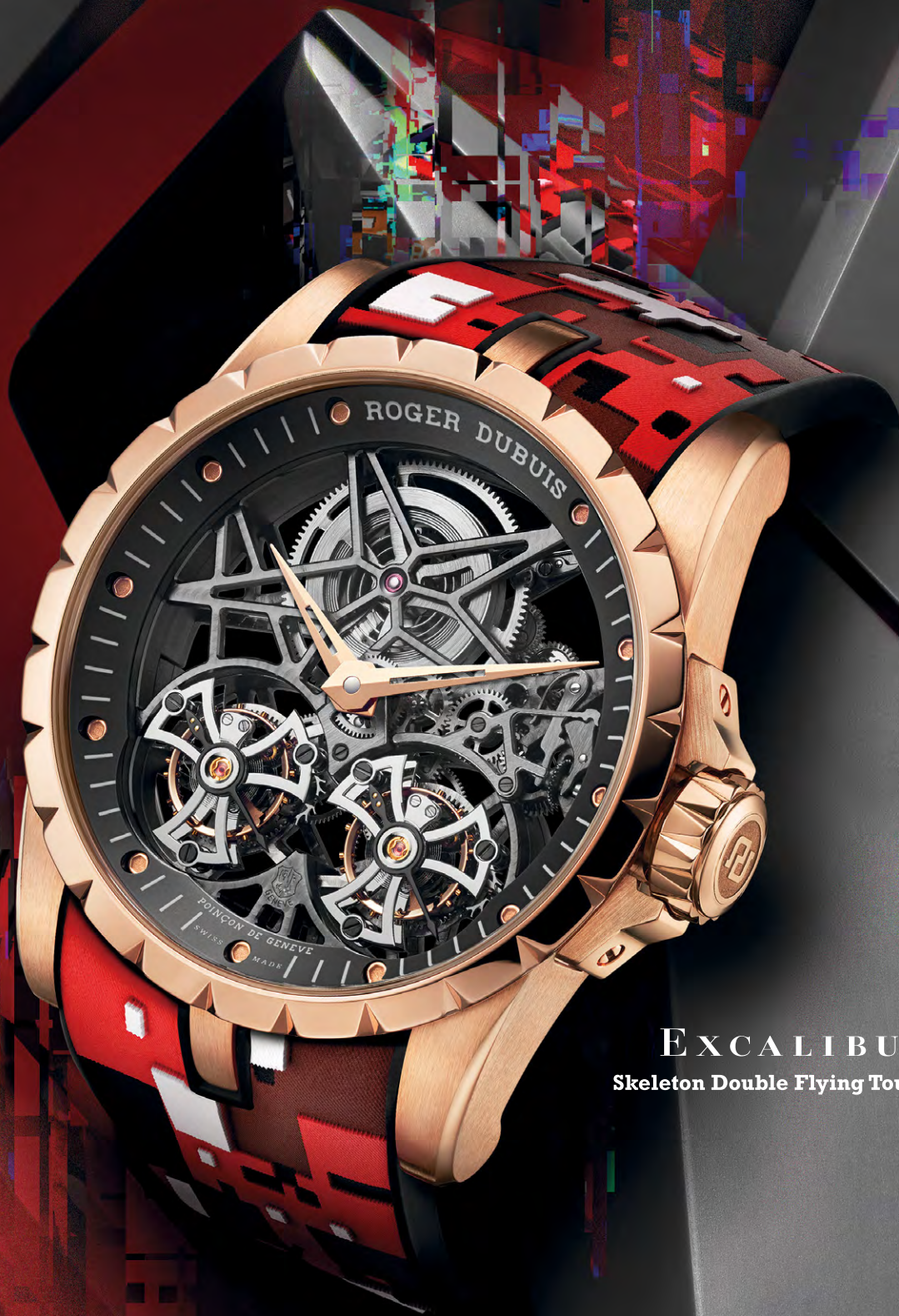
EXCALIBUR Skeleton Double Flying Tourbillon