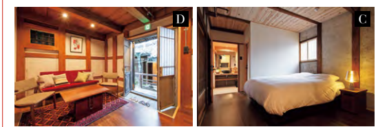
C:当時、蔵人たちの作業風景を見守ったシンボリックな建物の部屋“蔵人” D:古文書や財物が収められていた蔵の部屋“府庫”。18代め当主が古文書を読み解き、昔ながらの醤油を復活させるきっかけに。室内には歴史を記した書物も