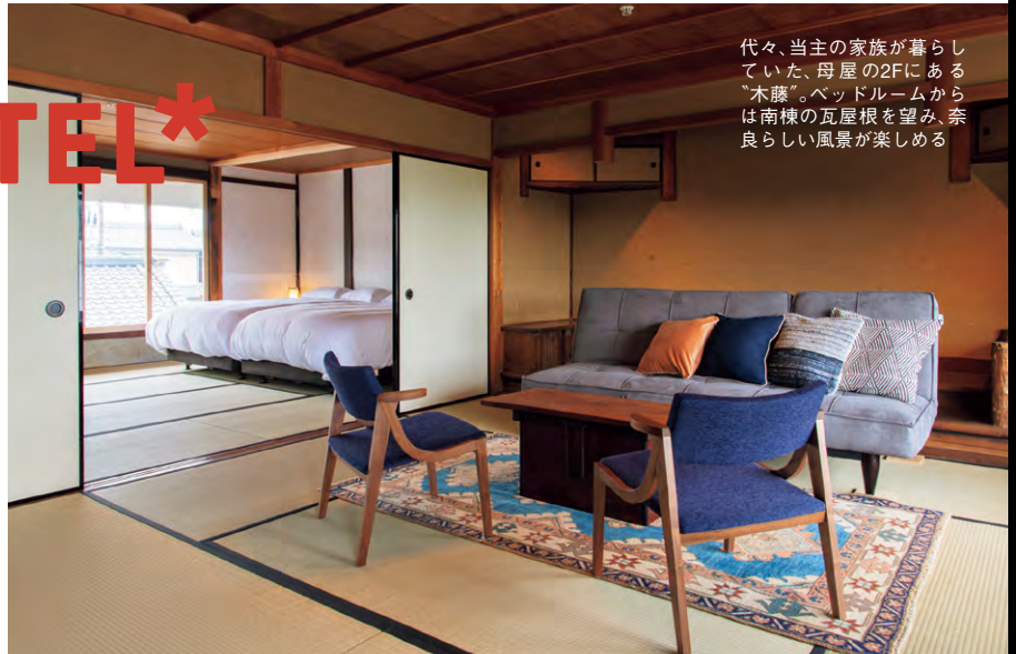
代々、当主の家族が暮らしていた、母屋の2Fにある“木蔭”。ベッドルームからは南棟の瓦屋根を望み、奈良らしい風景が楽しめる

④奈良県磯城郡田原本町伊与戸170 ☎0744-32-2064 https://maruto-shoyu.co.jp/