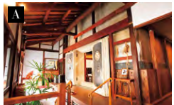
A:どっしりとした扉の蔵の中では、日によって、音楽イベントなどを開催。興味のあるイベントは、スケジュールを確認してみて B:蔵の隣のカフェ&ベースでは、地酒や季節のドリンク、和菓子など、八尾ならではのメニューをラインナップ

江 戸から明治にかけて栄えた坂の町・富山県八尾。かつて生糸や越中和紙を扱う問屋で、蚕業も営んでいた商家を一棟貸しに。明治5年に建造された、原材料や商品の集荷場として使われていた蔵を改築。コンセプトは“八尾の四季を感じる暮らしを体験する”。滞在中はコンシェルジュが町を案内。この地に根づく町人文化に触れ、地元の人との交流も