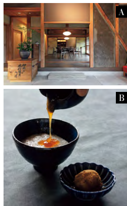
A:母屋の1Fにあるレストラン。土壁がいい風合い B:70年ぶりに復活させたマルト天然醸造醤油を使った、あんかけの朝食。大和の稲作発祥の地である田原本。手塩にかけて育てられた地元の野菜や、邪気を払うとされる古代桃など、自然の恵みを田園風景の中で