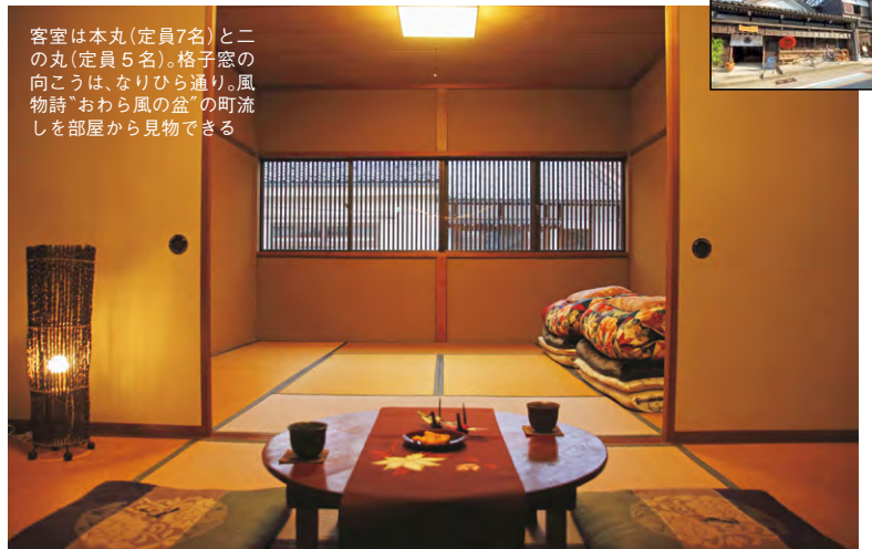
客室は本丸(定員7名)と二の丸(定員5名)。格子窓の向こうは、なりひら通り。風物詩“おわら風の盆”の町流しを部屋から見物できる