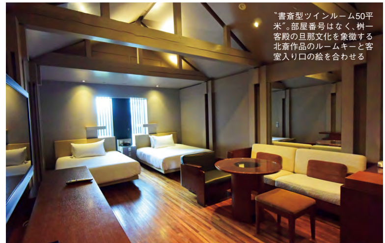
“書齋型ツインルーム50平米”。部屋番号はなく、榎一客殿の旦那文化を象徴する北斎作品のルームキーと客室入り口の絵を合わせる